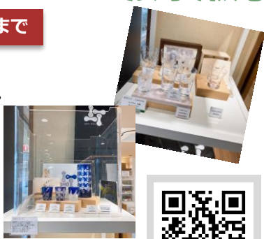
手仕事ショップ・フォレスト

区内店舗の商品を月替わりで紹介する「Pop Upコーナー」。12月は「手仕事ショップ・フォレスト」様の蒲田切子をご紹介します。水鏡などのオリジナル模様に加え、区の花である「梅」をテーマにした切りガラスも取り扱っております。ギフトや記念品にもぴったりの美しく実用性を兼ねたガラスです。新商品のご用意もありますので是非お立ち寄りください。